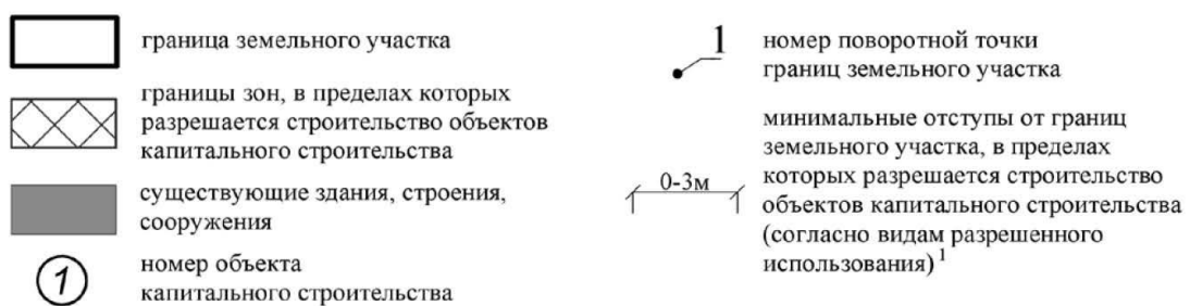
Рисунок 2 – Чертеж градостроительного плана земельного участка