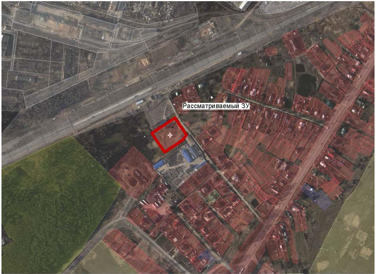
Рисунок 3 – Космоснимок рассматриваемой территории