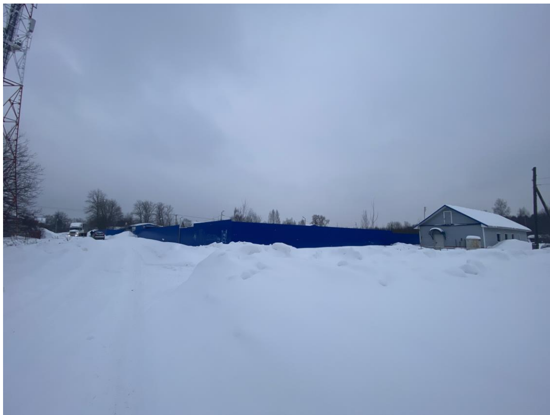
Рисунок 5 – Фотофиксация существующего состояния территории