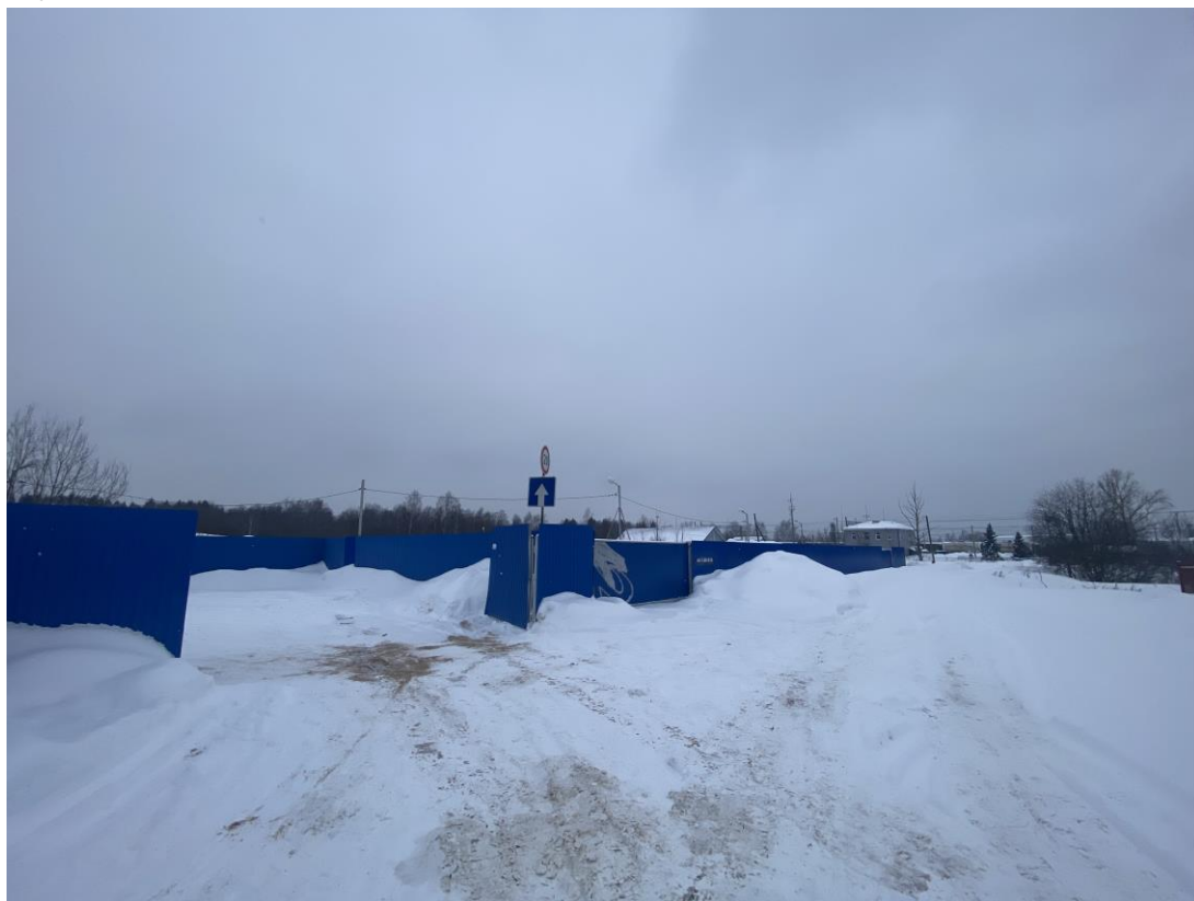
Рисунок 4 – Фотофиксация существующего состояния территории

Фотофиксация существующего состояния территории представлена на рисунке 4, 5.